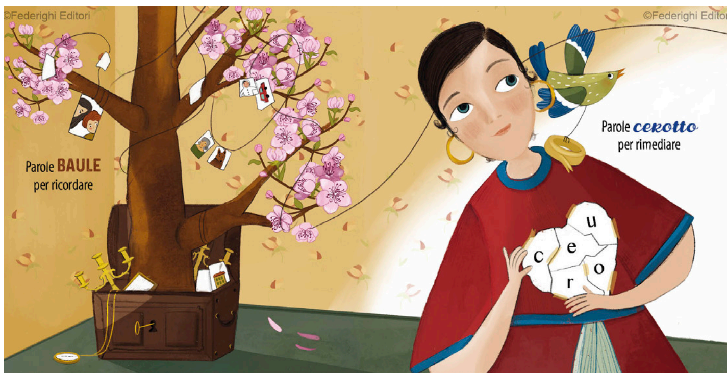
Un'apertura (due pagine affiancate) tratta da "Parole morbide parole ruvide - Emozioni da sentire" Testi di Cristina Bartoli, illustrazioni di Denise Damanti