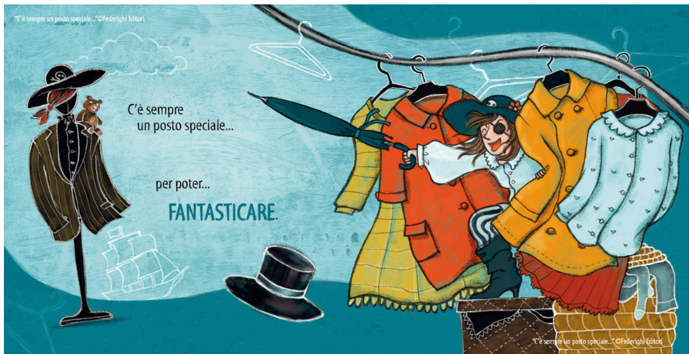
Un'apertura (due pagine affiancate) tratta da "C'è sempre un posto speciale..." Testi di Cristina Bartoli, illustrazioni di Celina Elmi