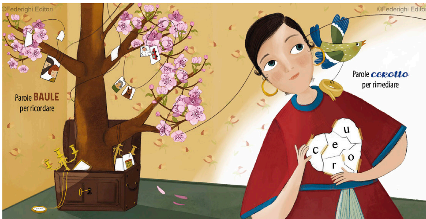
Un'apertura (due pagine affiancate) tratta da "Parole morbide parole ruvide - Emozioni da sentire" Testi di Cristina Bartoli, illustrazioni di Denise Damanti