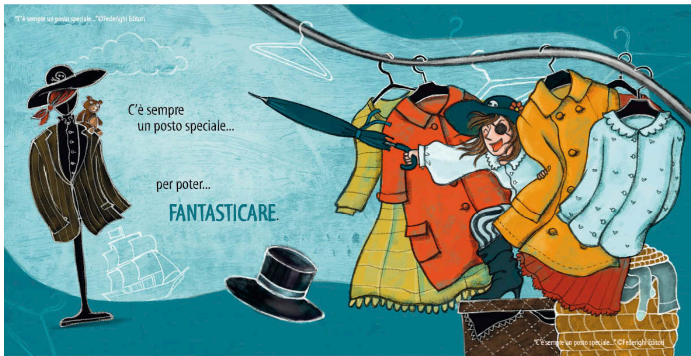
Un'apertura (due pagine affiancate) tratta da "C'è sempre un posto speciale..." Testi di Cristina Bartoli, illustrazioni di Celina Elmi